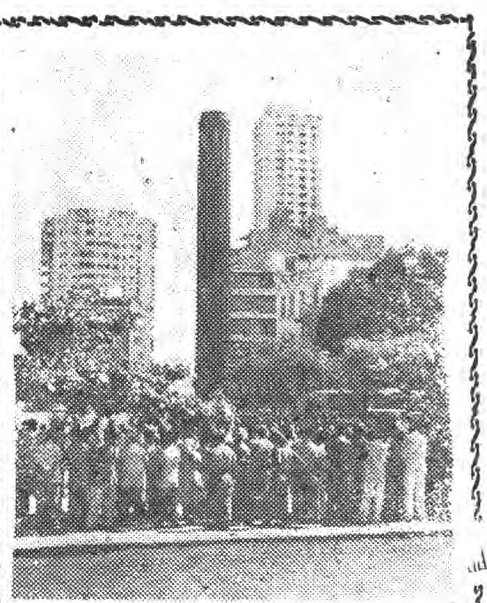
親密的友誼 古巴各界人民在哈瓦那中國戰士紀念碑前集會，紀念在古巴獨立戰爭中英勇犧牲的華僑烈士。在這個紀念碑上刻着古巴國薩洛將軍的贊詞：“在古巴的中國人，沒有一個是逃兵，沒有一個是叛徒”。

錫蘭總理西麗瑪沃·班達拉奈克夫人，在長期的歡迎掌聲中登台講話。她熱情地贊頌了錫蘭兩國人民的友誼，介紹了錫蘭的國內建設情況和對外政策。她在講話中還強調地談到了加強亞非團結的意義，再一次表達了她對促進中印和解的真心願望。 她再次表示贊賞中國政府方面在中印邊境全綫停火的步驟，她說：“科倫坡六國會議和全世界大多數人民都贊賞這個步驟。我們認為，這是向問題的最終解決前進了一大步。” 彭真市長和錫蘭總理講話以後，彭真市長代表首都人民向錫蘭貴賓贈旗贈禮。