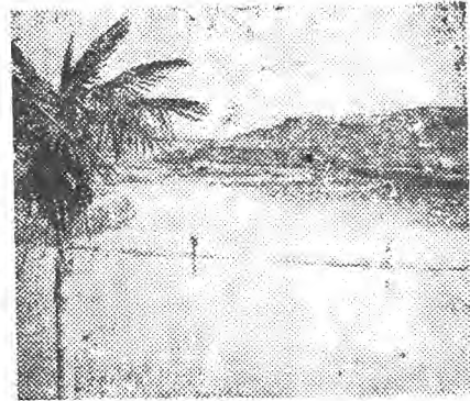
衛坪公社蔡市大隊第六生產隊的水田，冬水關得好，為水稻增產創造了良好條件。（銘源）